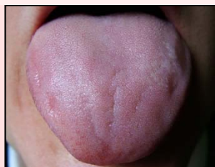
bledý, mírně modrofialový, nateklý