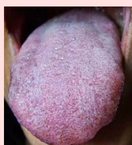
modro-fialová pravá strana (děloha)