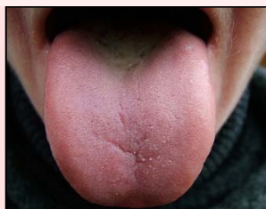
bledý a nateklý

Rozdíly oproti klasickému předchůdci: ● doplňování jangu ledvin ● oživování krve